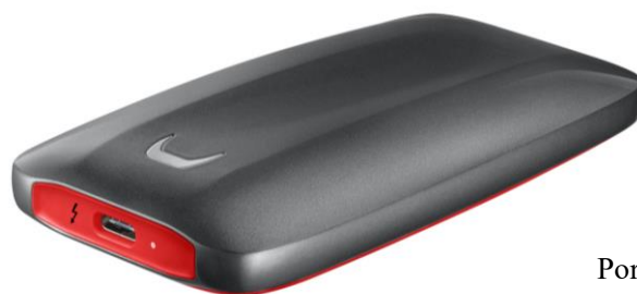
Portable SSD X5

日本サムスン株式会社(本社: 東京都港区、代表取締役: 金子根千)の販売特約店である ITG マーケティング株式会社(本社: 東京都港区、代表取締役社長: 左京 恒夫)は、Thunderbolt™ 3 テクノロジーを採用した超高速外付け SSD(Solid State Drive)として「Samsung Portable SSD X5(以下 X5)」を、2018年9月中旬より販売いたします。