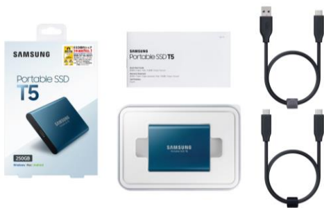
MU-PA250B/IT (250GB) MU-PA500B/IT (500GB)

日本サムスン株式会社(本社: 東京都港区、代表取締役: 鶴田 雅明)の販売特約店である ITG マーケティング株式会社(本社: 東京都港区、代表取締役社長: 左京 恒夫)は、USB3.1 インターフェース対応ポータブル SSD (Solid State Drive)として Samsung V-NAND を搭載した「Samsung Portable SSD T5 シリーズ(以下、「T5」)」を2017年9月上旬より順次販売いたします。