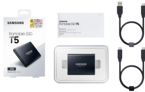
MU-PA1T0B/IT (1TB) MU-PA2T0B/IT (2TB)