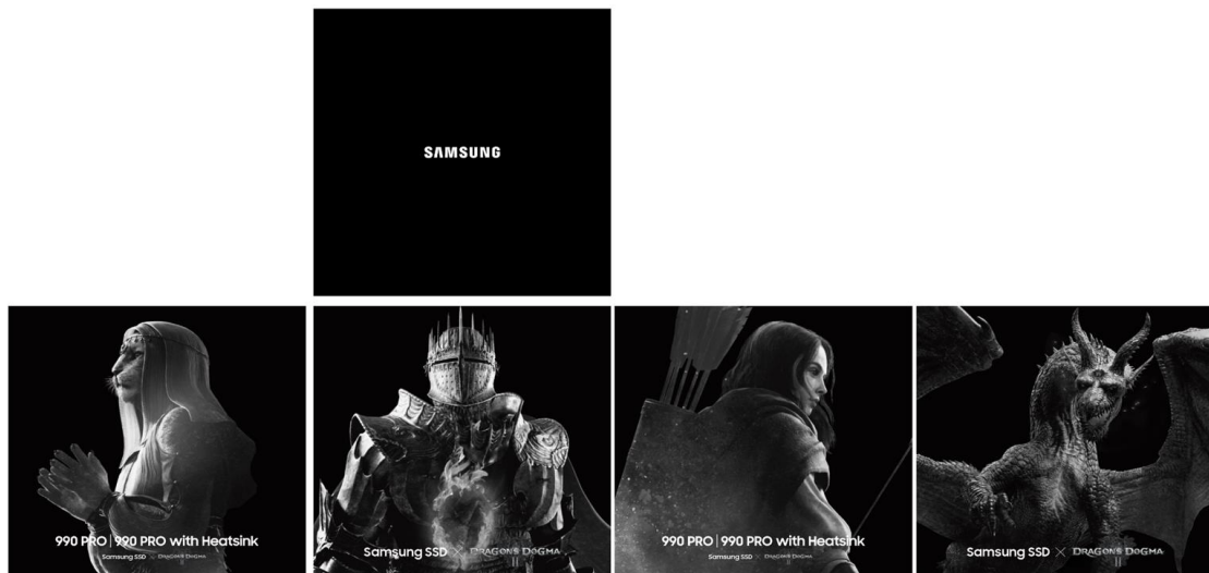
『ドラゴンズドグマ 2』コラボ収納ボックス (外箱) 展開図イメージ ※底面は無地となります。