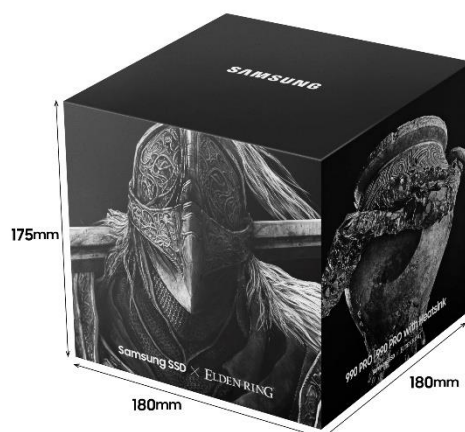
『ELDEN RING』コラボ収納ボックスイメージ